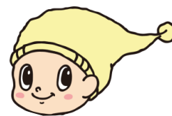
◆ キャラクターを解体する