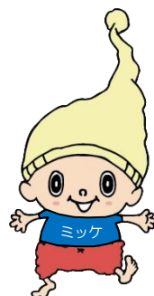
◆ ないものを加える