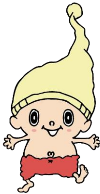
見附市、見附市観光物産協会キャラクター

「ミッケ」は平成14年10月に誕生しました。見附市と見附市観光物産協会のオリジナルキャラクターとして、見附を広くPRするために活躍しています。