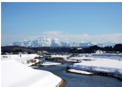
嶺崎橋から見る粟ヶ岳と刈谷田川