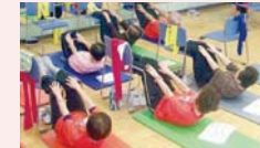
筋力トレーニング

脳血管疾患や心疾患のリスクが低下し、生活習慣病予防やメタボリックシンドロームなどの予防に効果があります。