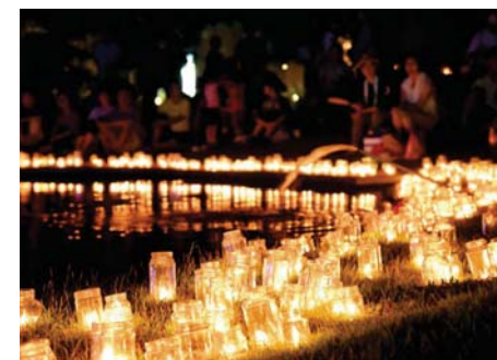
(↑↓) 令和元年度の夕暮れ音楽会の様子

▶定員 150人(見附市民のみ) ▶入園料 無料(管理協力金として、1人100円程度の寄付をお願いします)