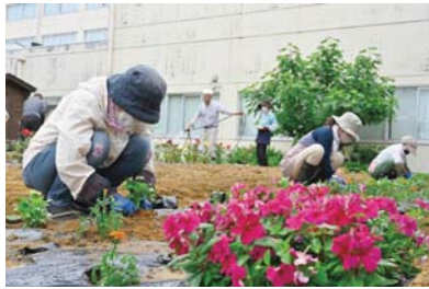
園芸福祉みつけのメンバーは他にも、市立病院や市役所前の樽プランターの管理、子育て支援センターや保育園での園芸体験のお手伝いなどの活動もしています。

6月13日、市立病院正面入り口脇の「花ガーデン」で、園芸福祉みつけのメンバー約10人が花の苗約250株を植栽しました。