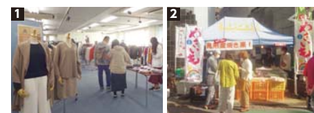
1 「見附のとおき百選」の会場では、モンゴル産カシミア100%の高品質ニットもお手頃価格で販売 2 屋外テントでは、その場で食べられる熟々の焼き栗や「シルクスイーツ」のやきいもが人気でした

参加者からは、「3年間待っていました。やはりリアル交流会は良いですね」、「これからも陰ながら見附を応援していきたいです」など、うれしい声をたくさん頂きました。