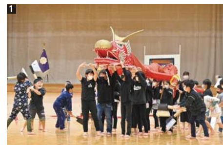
1 草薙龍を披露する児童。酒で酔わせた龍を村人が退治する様子を見事に演じきった