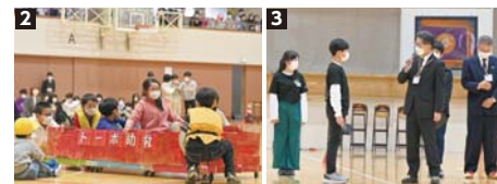
2 防災教育で学んだ人命救助の方法を、児童が演劇形式で披露 3 名木野小学校を卒業した地域住民に、在校生が当時の小学校の様子をインタビュー

11月5日、名木野小学校の創立150周年記念式典が開催され、来賓や児童・先生、保護者などが出席しました。