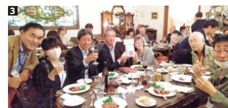
3 「東京みつけデー」の様子。初対面の参加者同士でも見附という共通の話題で盛り上がりっぱなし