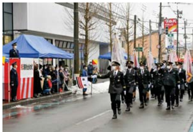
市内では8つの消防団が活動しており、549人が所属。団員たちは各自の仕事の傍ら、各地域で防災活動に励んでいます。

式典後は、アルカディア前の駐車場で「屈折はしご付き消防ポンプ自動車」による祝賀放水を実施。その後、消防団員と消防車による分列行進もネーブルみつけ前で行われ、団員たちは見学に来た市民らに見守られながら、威風堂々と行進を行っていました。