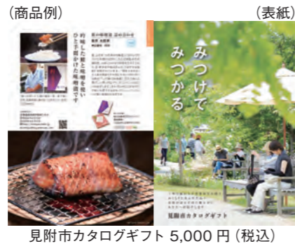
見附市カタログギフト 5,000円 (税込)

市内の老舗料亭の味や銘菓など、見附の逸品を大切な人に贈りませんか。見附の名店の味を詰め合わせた「どまいちセレクション」や、見附の定番商品を掲載した「見附市カタログギフト」など、お中元にぴったりの商品を取り揃えています。