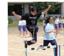
ダナンの中学生2人は、体育の授業で50メートルハードルにも挑戦。現地の中学校はグラウンドがせまく体育の授業が日本ほど盛んでないため、2人は広いグラウンドで楽しそうに体を動かしていました。