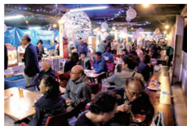
昨年のイベントの様子

から事務局側で3、4作品に絞り込みます。その後、9月開催予定のイベントの来場者投票で順位を決定します。 ●提出・團 8月7日(水)までに、市ホームページに