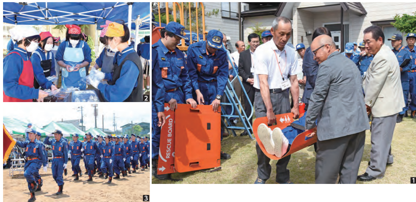
1 上新田町で行われた搬送訓練 2 今町中学校2年生による炊き出し訓練。防災訓練には市内4中学校から815人が参加 3 約500人の消防団員による分列行進 4 桜保育園児による防火遊戯

6月9日、豪雨災害を想定した防災訓練が市内全域で行われました。当日は約1万2千人の市民が参加。緊急情報メールや防災サイレンの音に合わせて地域の避難所に避難していました。