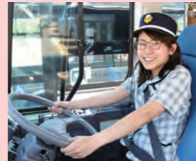
新人女性ドライバー