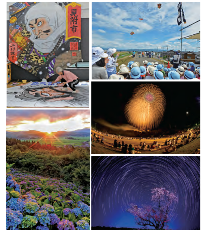
※過去の受賞作品より抜粋して掲載しています