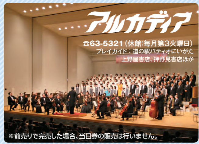
※前売りで完売した場合、当日券の販売は行いません。

親子で歌って踊って一緒に楽しめるケロボンズのコンサートです。代表作「エビカニクス」はYouTubeの動画再生回数で5000万再生を超えるほどの大人気。この機会にぜひご来場ください。