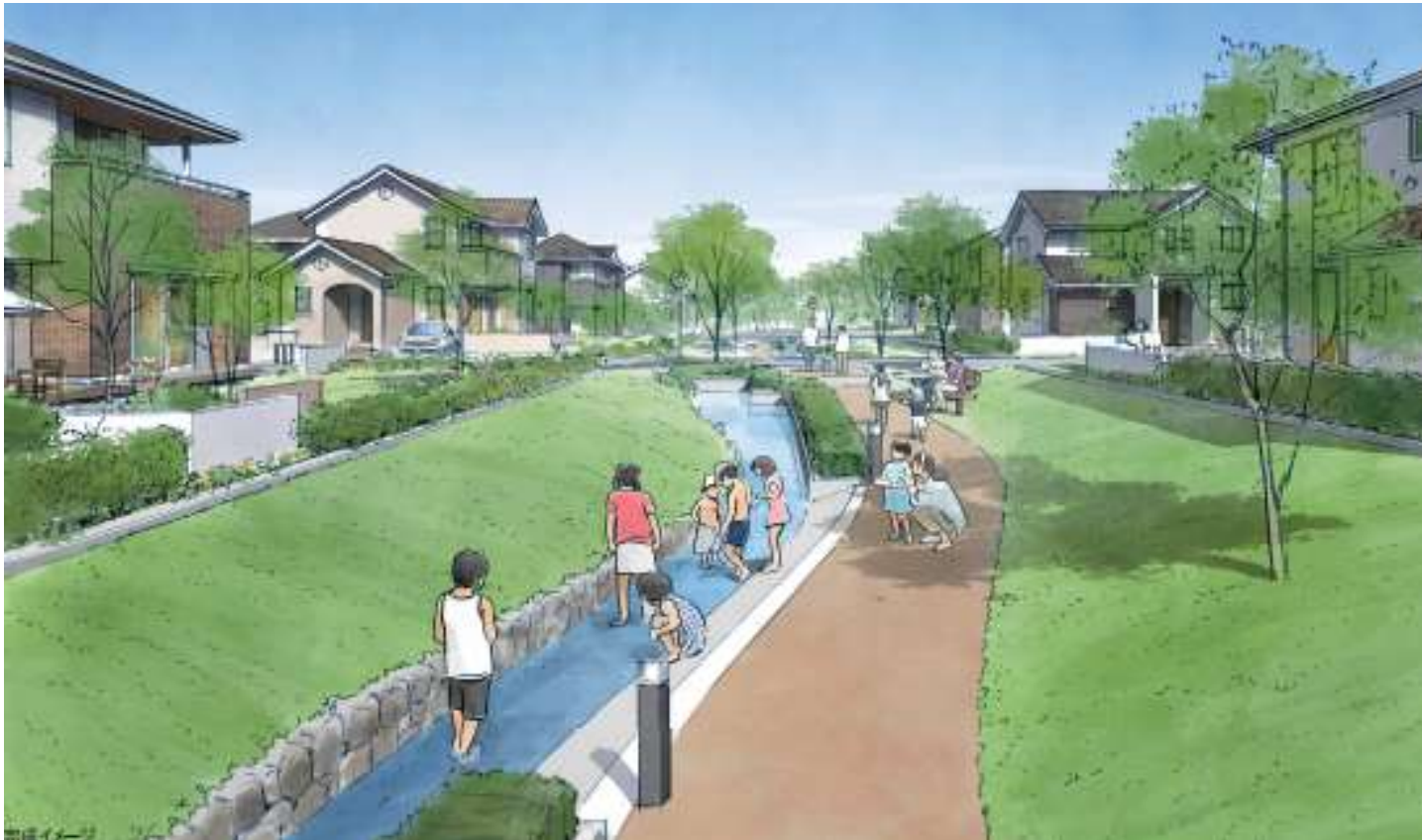
自然と人が集まり、コミュニティが育まれる共有スペース（イメージ）