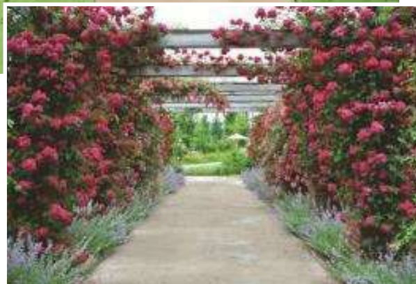
イングリッシュガーデン 6月の様子