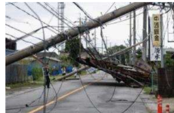
台風により倒壊した電柱