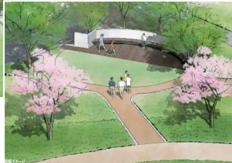
③ゆったり過ごせる川岸広場（イメージ）