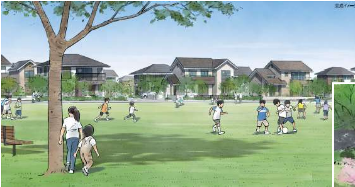
①子どもが活発に遊べる芝生広場（イメージ）