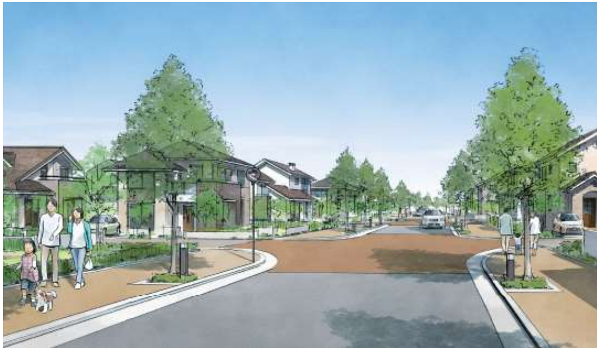
電線・電柱のない街並み (イメージ)