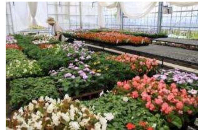
イングリッシュガーデン 育苗施設 配布された花苗が市内各所を花で彩ります