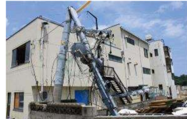
地震により倒壊した電柱