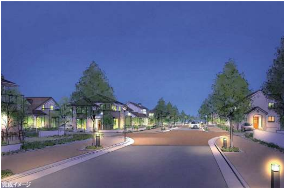
メイン道路沿いの照明（イメージ）