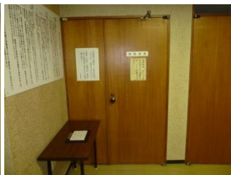
④突きあたりに傍聴席入口があります。傍聴受付簿に記入し、ご入場ください。