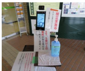
①1階正面玄関で検温をお願いいたします。