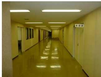
③5階中央の通路をまっすぐお進みください。