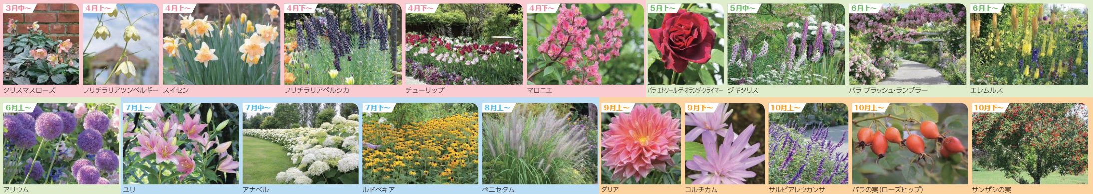
3月中～ クリスマスローズ 4月上～ フリチラリアツツベルギー 4月上～ スイセン 4月下～ フリチラリアベルシカ 4月下～ チューリップ 4月下～ マロニエ 5月上～ 白エトワール・チオランダクワイマー 5月中～ ジギタリス 6月上～ バラ ブラッシュ・ランブラー 6月上～ エレムルス 6月上～ アリウム 7月上～ ユリ 7月中～ アナベル 7月下～ ルドベキア 8月上～ ペニセタム 9月上～ ダリア 9月下～ コルチカム 10月上～ サルビアレウカンサ 10月上～ バラの実(ローズヒップ) 10月下～ サンザシの実

※赤字は飲食可能なスペースです 子ども広場、ガゼボ(東屋) ガーデンテント (園内にはごみ箱を設置しておりません。 ごみのお持ち帰りにご協力ください。)