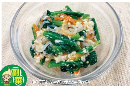
(-) 見附のイマージュキャラクター「ミツケ」