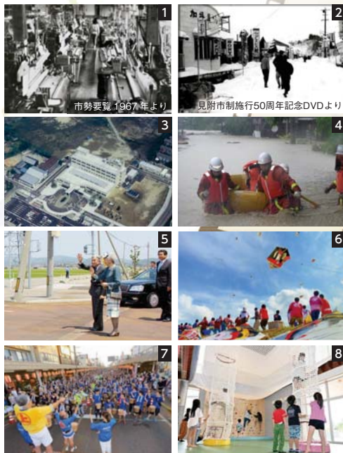
1 終戦後から産地形成が進んだ繊維産業 2 38 豪雪で雪に埋まった街並み 3 建築当初の市立成人病センター病院 4 7.13 水害、中越地震と災害が続いた 2004 年 5 行幸啓で 7.13 水害からの復旧状況をご視察になった天皇皇后両陛下 6 市内外から観客が訪れる見附今町・長岡中之島大凧合戦 7 第 50 回見附まつりのギネス世界記録への挑戦には 1,171 人が参加した 8 子どもたちが放課後や休日に利用できるプレイラボみつけ