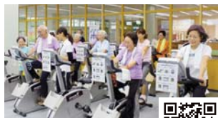
運動の内容など、詳細は市ホームページ（→）へ。