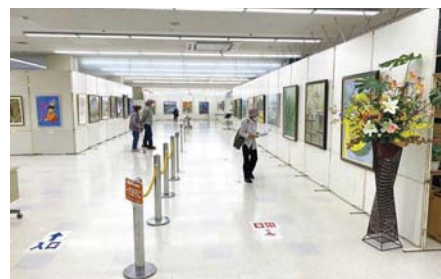
▲昨年の会場の様子