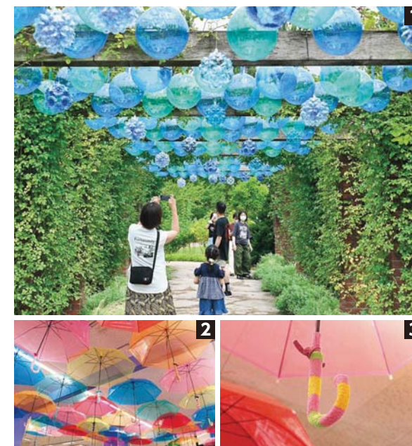
1 暑い夏は涼やかなサマーディスプレイで気分転換 2 3 ネーブルみつけでは、色とりどりの傘が館内に明るさをプラス。傘の柄を見附の特産品「ニット」で装飾し、オリジナリティを演出しました。

カラフルな傘の花が彩る「アンブレラスカイ」と「サマーディスプレイ」が、それぞれネーブルみつけとみつけイングリッシュガーデンで開催され、色鮮やかな空間が会場内に広がっていました。