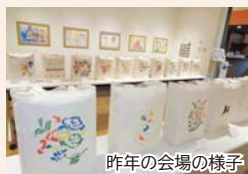
昨年の会場の様子

会 展示室1・2 夏休みに「わくわく体験塾」ギャラリー講座を受講した小学生たちの作品を展示します。