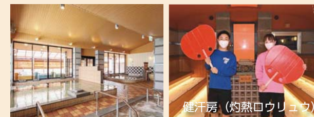
健汗房（灼熱ロウリュウ）

6種類のお風呂と遠赤外線サウナ、県内屈指の岩盤浴を備える入浴施設。多量の発汗とアロマによるリラックス効果を楽しめる「灼熱ロウリュウ」も人気です。