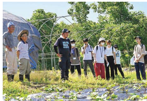
上北谷地区でさつまいも栽培を行っている農家団体「上北谷物語」の畑を視察する学生たち。

6月28日と30日、新潟大学創生学部の学生6人が上北谷地区や旧栃窪町の農家を訪問し、農業のやりがいや経営手法、地域の農業が抱える課題などを学びました。