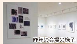
昨年の会場の様子

会 展示室1・2(最終日は16:00まで) 新潟県内の銅版画家たちのグループ展を開催。