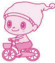
見附のイメージキャラクター『ミック』

イベントカレンダーは、市内のいろいろなところで配布しています。(QRコードの下をご覧ください)市のホームページやスマートフォンアプリ「マチイロ」でも見るすることができます。