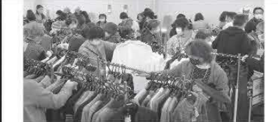
見附の高品質のニットをお手頃価格で