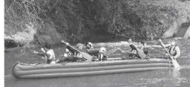
刈谷田川で楽しい時間を過ごそう