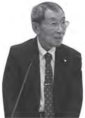
馬場 哲二 議員