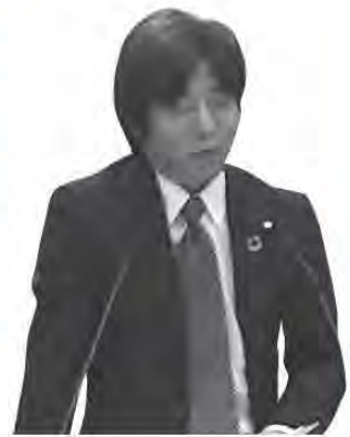
純 直 澤 樺 議員

答弁 公務災害として補償基金へ資料提出し進めている。民事補償については事例から言えば承知しているが、具体的になれば対処したい。