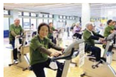
健康づくりに参加して…

月間最大 200 ポイント！ 総合型地域スポーツクラブ、健康運動教室（次ページ）などの健康プログラムに参加。