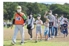
推奨歩数を達成して…

月間最大 200 ポイント！ 総合型地域スポーツクラブ、健康運動教室（次ページ）などの健康プログラムに参加。