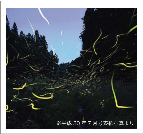
※平成 30 年 7 月号表紙写真より