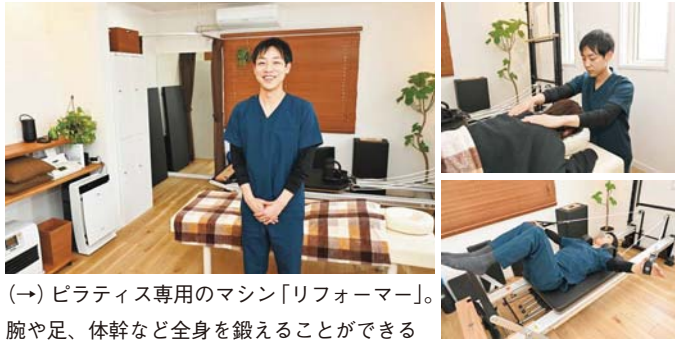
（→）ピラティス専用のマシン「リフォーマー」。腕や足、体幹など全身を鍛えることができる

同院のもう一つの特徴は、全身のバランスを整えるエクササイズ「ピラティス」を、昨年より新たに取り入れること。専用マシンを用いたトレーニングは、怪我の予防や身体のゆがみの改善に効果を発揮します。ピラティス単独のパーソナルレッスンも実施するなど、医療とピラティスの両面から、利用者の身体と向き合っている整骨院です。