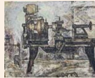
さんぼんこうじょう 『旋盤工場』2009

西山町在住の日展・光風会で発表する洋画家を紹介。作家の子供の頃の思い出、祖父の旋盤工場をモチーフにした大作の油彩画を中心に展示します。