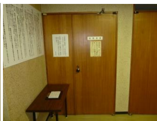
④突きあたりに傍聴席入口があります。傍聴受付簿に記入し、ご入場ください。