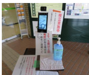
①1階正面玄関で検温をお願いいたします。