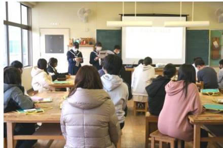
【1年生による学校説明】