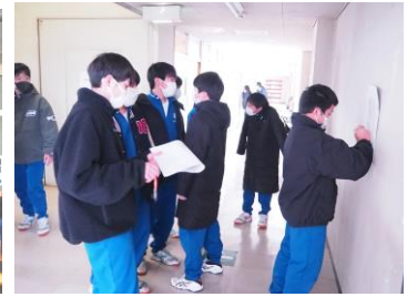
【全校ウォークラリー】