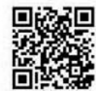
スマイルみつけ 子育て応援マップ

■最新情報は「スマイルみつけ」 (子育て応援マップ) で検索または、 スマートフォンなどで下記QRコード を読み取りご覧ください。