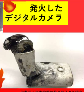
発火した デジタルカメラ