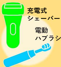
充電式 シェーバー 電動 ハブラシ