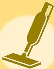
コードレス掃除機