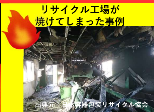
リサイクル工場が 焼けてしまった事例