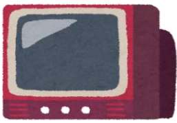
テレビ(液晶テレビ)