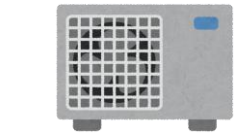
エアコン (室内外機)