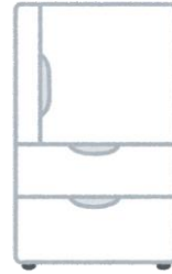
冷蔵庫 (冷凍庫含む)