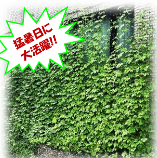
素敵なグリーンカーテンになりました。