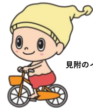
見附のイメージキャラクター ミッケ