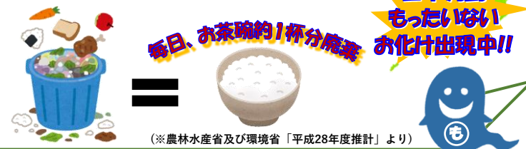
(※農林水産省及び環境省「平成28年度推計」より)

このうち、食べられるのに廃棄される食品（ 食品ロス ）は、643万トン(※)と試算されています。食品ロスを、国民一人あたりに換算すると「お茶碗約1杯分(139g)の食べ物」が毎日捨てられていることとなります。