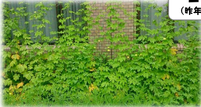
ゴーヤ (昨年の様子)