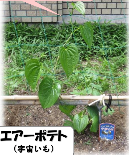
エアポテト (宇宙いも)

収穫時期: 【ゴーヤ】7月~8月 【エアポテト】10月~11月 収穫物は、市役所1階ロビーにて展示しますので、ぜひご覧ください!