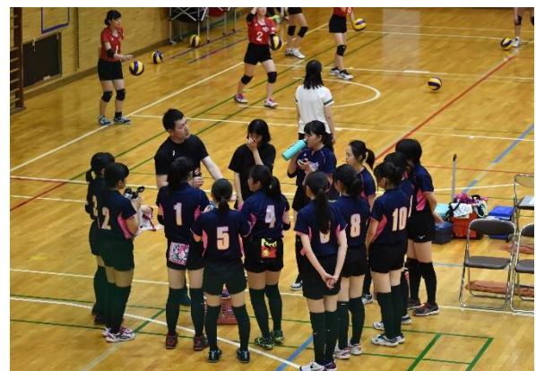
【部活動の大会で引率、指導】