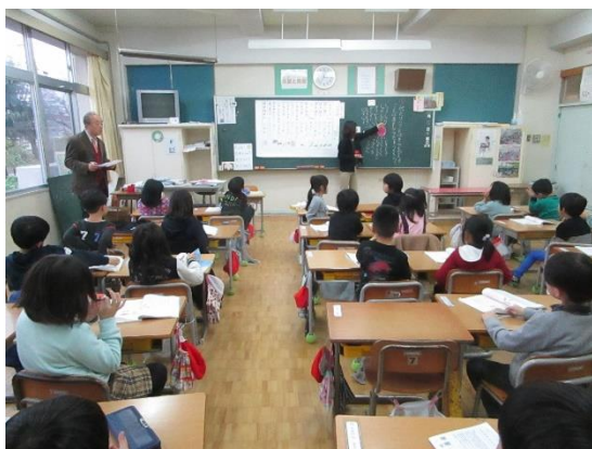
【教材研究をもとにした授業を実施】