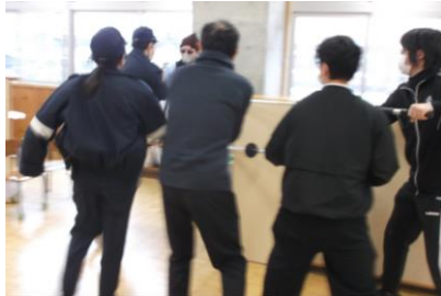
職員への対応(対峙)の様子