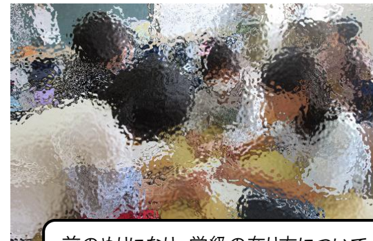
前のめりになり、学級の在り方について話し合っている様子

その後、「どんな学級にしたい？」「そのためにどんなルールが必要かな？」と、学級みんなで話し合いました。大事なことは、自分の思いを伝えること、仲間の思いを否定しないこと、みんなで納得して決めることです。じっくり時間をかけて話し合い、みんなが目指す学級像を共有できるように活動しました。