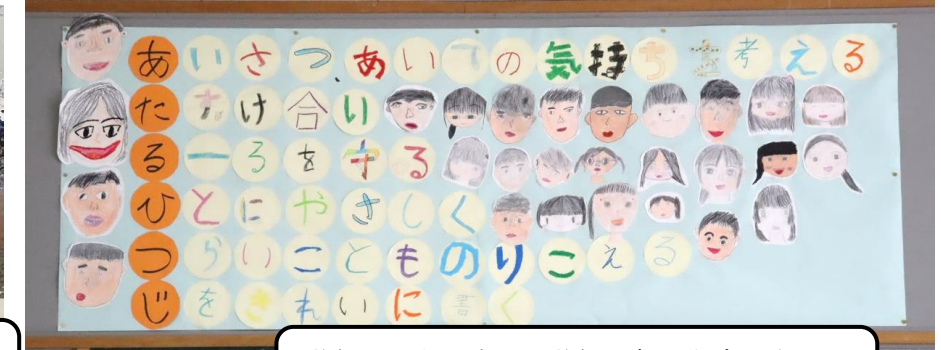
学級みんなで決めた学級目標。作成過程にも子どもたちの協働の姿が感じられます。