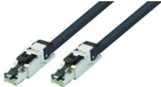
【移動用 LAN ケーブル】 参考品番：ETC6A-10-T