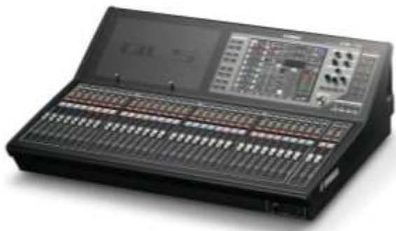
【デジタルミキシングコンソール】 参考品番：QL5 (YAMAHA)