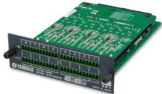
【AD/DA カード】 参考品番：MY8ADDA96