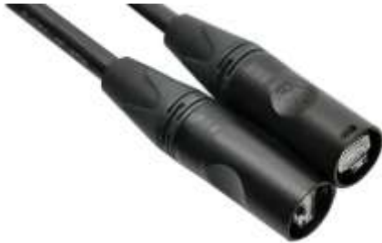
【移動用 LAN ケーブル】 参考品番：ETC6A-05-N