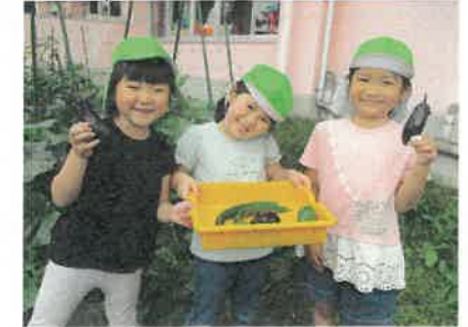
私たちが育てた野菜だよ！