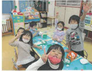
お友だちと一緒に、たのしいな。