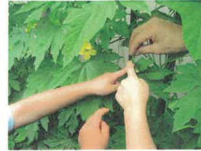
グリーンカーテンで夏を涼しく！ 赤ちゃんゴーヤみ～つけた！