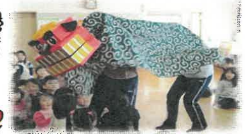
新年を元気にスタート！ 獅子舞登場にみんなびっくり！