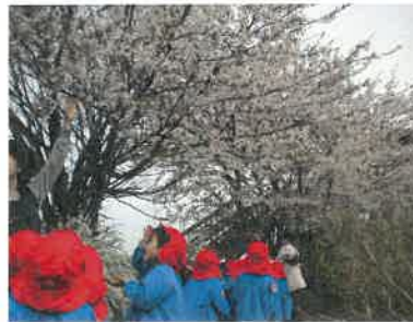
土手をお散歩。桜のトンネルだね！