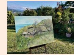
早津剛「久田の家」 三島郡出雲崎町久田1989

魚沼市在住の画家早津剛の展覧会を開催。見附市内をはじめ、県内の茅葺きの家や町家を描いた作品約40点を展示します。※一部展示販売あり。