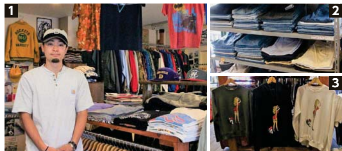
1_清水さん選りすぐりの古着が並ぶ店内 2_年代によってシルエットや雰囲気に違いのあるデニム 3_スウェットはお店のオリジナルデザイン