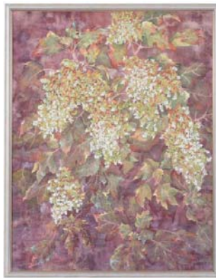
▶日本画 「柏葉あじさい」北澤 幸枝