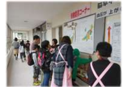
小学校にて親子への伝達活動