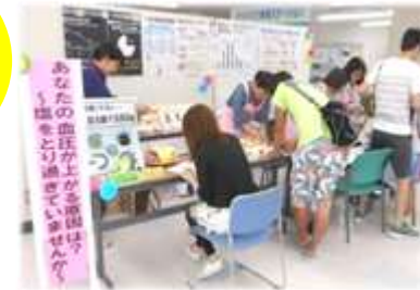
健幸フェスタの様子