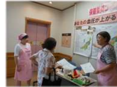
健診会場での伝達活動