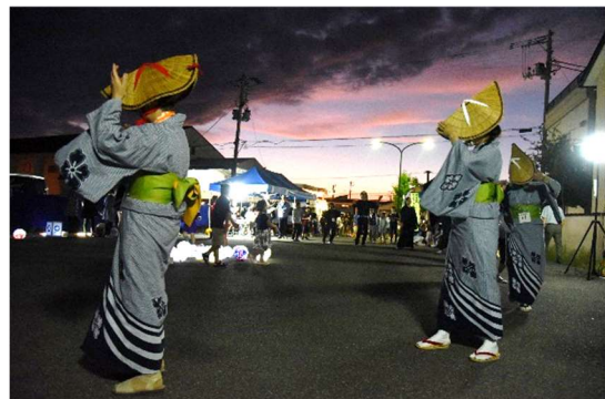
昨年のみつけるプロジェクト vol.3 (見附盆踊り保存会-紡ぎ-とコラボし実施したイベントの様子)

当日は参加者を限定し、ソーシャルディスタンスの確保などの新型コロナウイルス感染症対策を講じつつ見附盆踊りを踊ります。残念ながら一般の参加はできませんが、後日、盆踊りの様子を撮影した動画を、オンラインで配信する他、市内各公共施設等でも放映する予定ですので、乞うご期待ください。