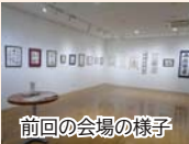
前回の会場の様子

市内の公共施設ふぁみりあで活動する「いろはの会」と今町公民館で活動 する「玉門会」二つの書道サークルが合同で開催する2回目の書展です。