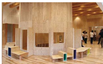
(↑) 全面木質化、居室は全室個室となっており、子どもたちの居場所づくりを意識した設計。令和2年には、第14回キッズデザイン賞最優秀賞「内閣総理大臣賞」を受賞。

当施設は昭和38年に開所。平成30年に敷地内に増設する形で、現在の建物を建築しました。