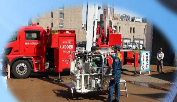
車両展示・写真撮影