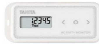
タニタ活動量計 (AM-151) ※見附市専用の機器です

参加費 【活動量計コースの方】 5,390円 ※既にお持ちの場合は参加費不要です 【アプリコースの方】 2,000円