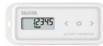
タニタ活動量計 (AM-151) ※見附市専用の機器です

参加費 【活動量計コースの方】 5,390円 ※既にお持ちの場合は参加費不要です 【アプリコースの方】 2,000円