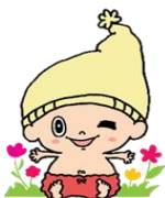
見附のイメージキャラクター『ミッケ』

イベントカレンダーは、公式LINEなどで配信しています。市のホームページでも見ることができます。