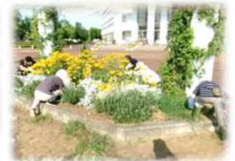
花育ボランティア