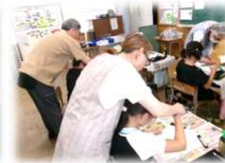
いろいろボランティア