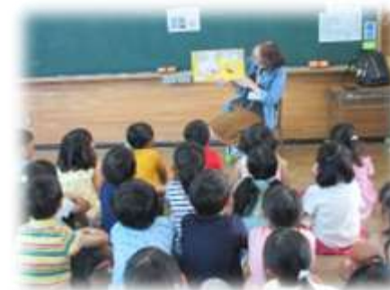
読み聞かせボランティア