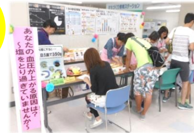
健幸フェスタの様子