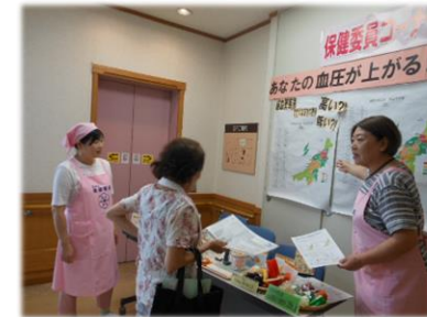
健診会場での伝達活動