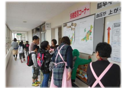
小学校にて親子への伝達活動