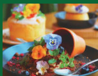
ティラミスの果実