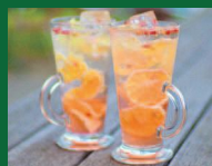
ローズレモネード