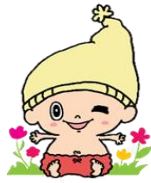
見附のイメージキャラクター『ミック』

イベントカレンダーは、公式LINEなどで配信しています。 市のホームページでも見ることができます。