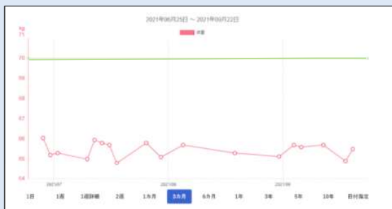
【ダッシュボード画面】