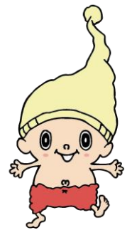
見附のイメージ キャラクター「ミツケ」