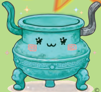
片桐庵寺跡 かなえ キャラクター 鼎ちゃん