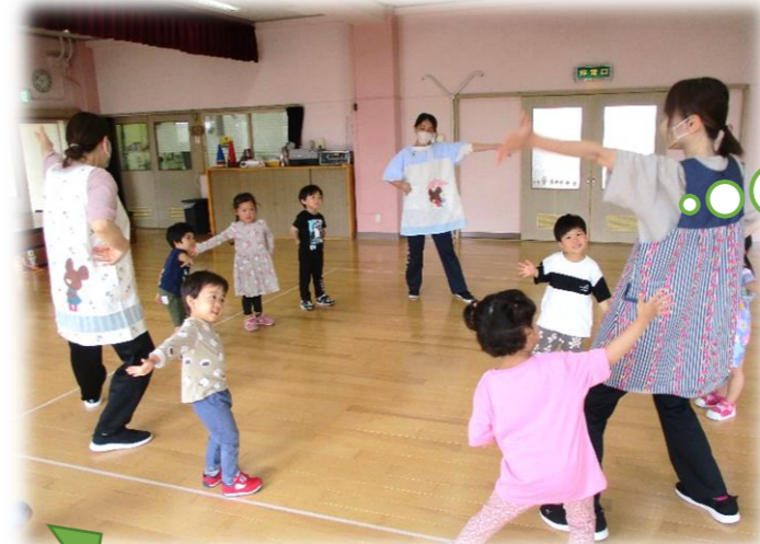
「おたまじゃくし体操」 足が出て、手が出て、しっぽがなくなっ てかえるに変身することを踊りで表 現。最後はみんなでぴょーん！