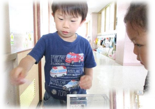
「えさやり当番」 毎日の楽しみに なっています。