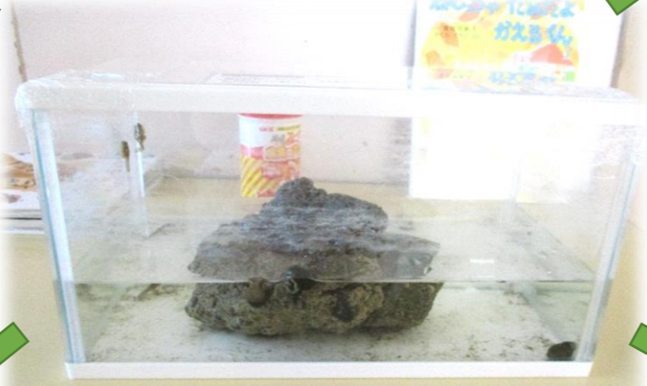
おたまじゃくしの観察から 色々な活動や遊びに展開！