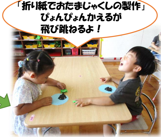
「折り紙でおたまじゃくしの製作」 ぴょんぴょんかえるが 飛び跳ねるよ！