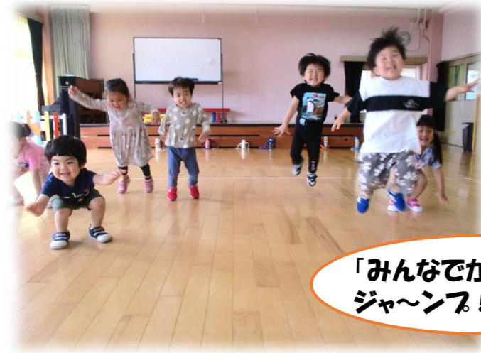
「みんなでかえるに変身」 ジャ〜ンフ！！

おたまじゃくし？知らない！見たことない！と言っていたさくら組さん。飼育や観察を通して、足や手が出てきたり、しっぽが短くなったり、水の中から石の上で過ごすようになってきたり、かえるになると緑色に変わったり…初めて見るおたまじゃくしにたくさんの発見をしています。飼育から色々な楽しい活動にも発展し、楽しんでいきます！