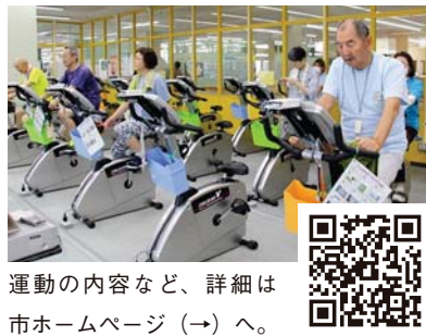
運動の内容など、詳細は市ホームページ（→）へ。