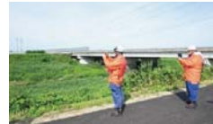
被害状況を撮影し、水防システムで送信。

今回、消防団が現場で活動している状況、現場写真などの情報をリアルタイムに共有する、日本初の流域デジタル水防システムを活用した訓練を実施しました。刈谷田川の氾濫状況を消防団がスマホで撮影し、災害対策本部に共有。