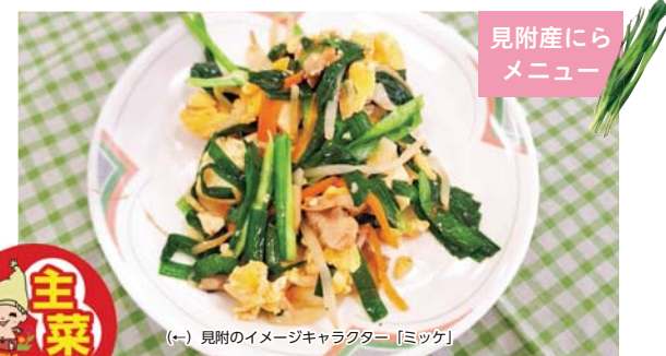
見附産にらメニュー