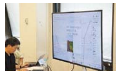
被害状況が、災害対策本部のモニターに共有。

災害対策本部のモニターに、現場の位置情報、被害写真が即座に共有され、正確な被害状況の把握が可能になりました。