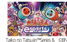
Taiko no Tatsujin™Series & ©BNEI

和太鼓リズムゲーム「太鼓の達人」を使った、誰でも気軽に参加できるeスポーツ体験会を開催します。【時間】9:00～12:00