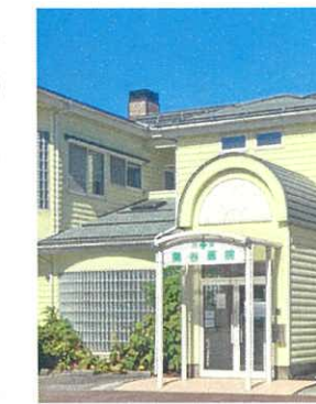
関谷医院まで徒歩4分 (270m)