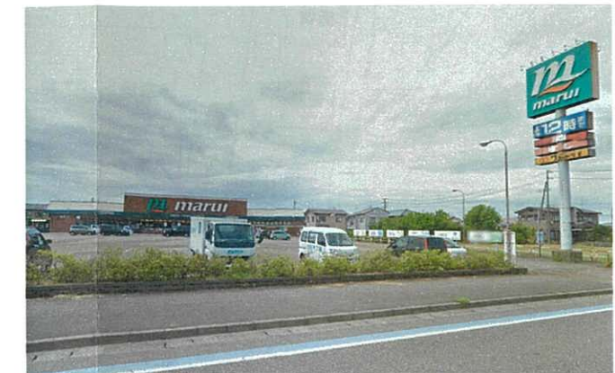
スーパーマルイまで徒歩2分 (160m)