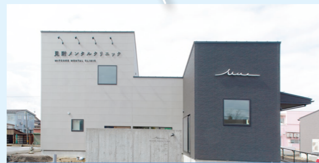
見附メンタルクリニック (精神科・心療内科)

(※) 補助金は、診療科目などによって上限額が異なります。制度内容に関する問い合わせは、健康福祉課(☎61-1370)へご連絡ください。