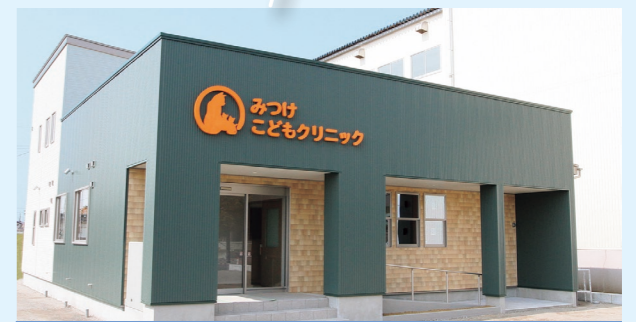
みつけこどもクリニック (小児科・アレルギー科)

●診療日 月~水、金曜日の8:45~12:00、14:00~16:00(予防接種・乳児健診)、16:00~18:00 木・土曜日の8:45~12:30