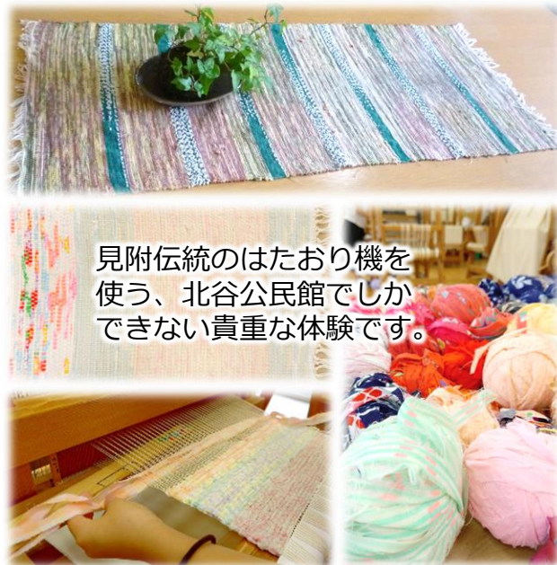
見附伝統のはたおり機を使う、北谷公民館でしかできない貴重な体験です。