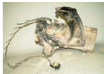
発火した温水洗浄便座

便座取付部分の電源コードが開閉時の屈曲により半断線状態となって熱をもったために発火し、樹脂製カバーなどに着火したものです。