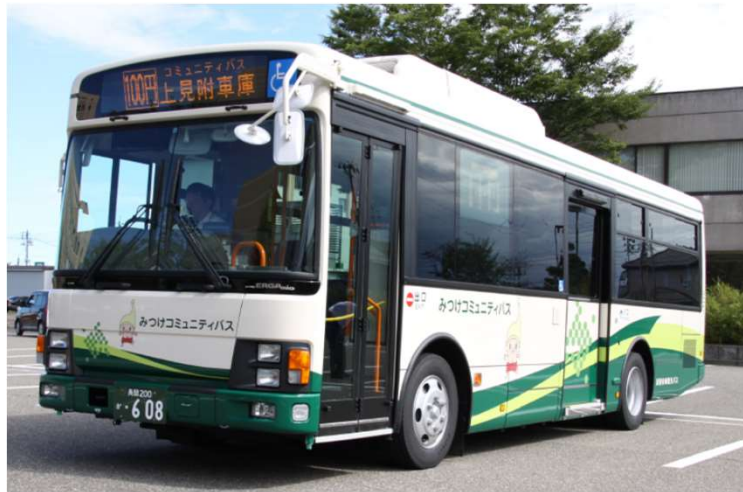
エルガミオタイプ