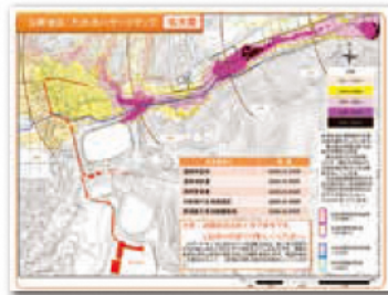
ため池ハザードマップ

ため池決壊時の避難方法などは、各地区ごとに決まっています。詳しくは、各地区のため池ハザードマップをご確認ください。 見附市ホームページで公表していないため池ハザードマップは、各地区の農家組合長までお問合せください。